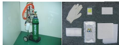
ディーエス・ミスター ゲロボックススピードパック