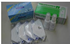
サイプレスクリア、マスク、手袋