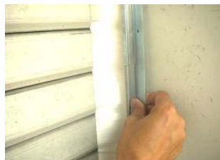
シャッター側面IGブラシ(曲)使用