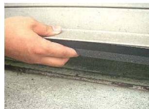
シャッター底部IGパッキン使用