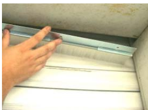
シャッター上部IGブラシ(平)使用

わずか2~3mmの隙間でも小さい昆虫などにとっては十分な侵入経路となります。その隙間を閉塞するための資材として、IG(インセクトガード)があります。シャッター、鉄扉、マンドア、窓などに生じている隙間を 開閉できる状態 のまま閉塞できることが特徴的です。IG資材の種類には①毛足の長いIGブラシ、②弾力性のあるIGパッキン、③毛足の短いIGパイルがあります。実際に侵入源にIG資材を取りつけることで、昆虫の捕獲数は確実に減少します。IG資材取り付け作業以外にも様々な施工を行っていますので、お困りのことがありましたらご相談ください。