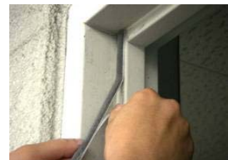
マンドアIGパイル使用