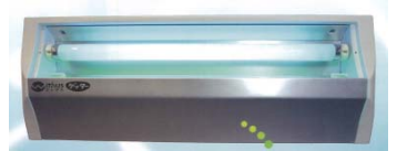
ウィザスゲッター

実際に食品工場での大型ハエの防除にも導入しており、その他各種工場だけではなくバックヤードや厨房など多くの場所での使用が可能です。また、捕獲された虫が外から見えにくい構造のため、人目につきやすい場所への設置もお勧めできます。