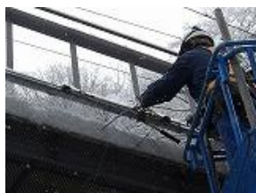
防鳩ネット設置施工