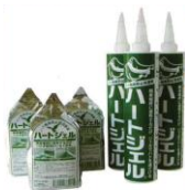
ハートジェル(忌避剤)

弊社へ寄せられるご相談の中には「鳥類(鳩など)の糞の被害に困っている」「鳥が巣を作ってダニが出る」「鳥が巣を作り雛鳥がいる」「鳥類がベランダの格子によく集まる」といったこともあります。