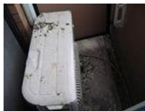
鳩の糞によるエアコンの室外機の汚染

そのため、鳩など鳥類の被害でお困りという場合は一度専門の業者に相談する方が安全であり、かつ確実に被害の解消へとつながります。