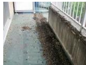
ベランダに落とされた鳩の糞害