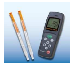
ルミテスター、ルシバックPen (キョーマンバイオケミファ㈱HP参照)

また、ノロウイルスに対してアルコールは効きにくいため、ノロウイルスを不活化させる効果を実証されているアルコール（サイプレスクリア：ヒノキから抽出した天然由来成分ヒノキチオール等含有した70%アルコール）等の販売も行っています。弊社では、サイプレスクリアの販売当初から、食品工場や病院での使用実績もありますので、ご興味・ご心配なことがあれば弊社にお問い合わせください。