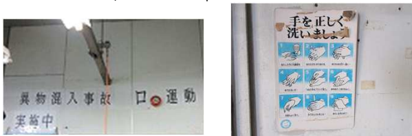
写真1. 文字の欠けたスローガン 写真2. 劣化した手洗いポスター